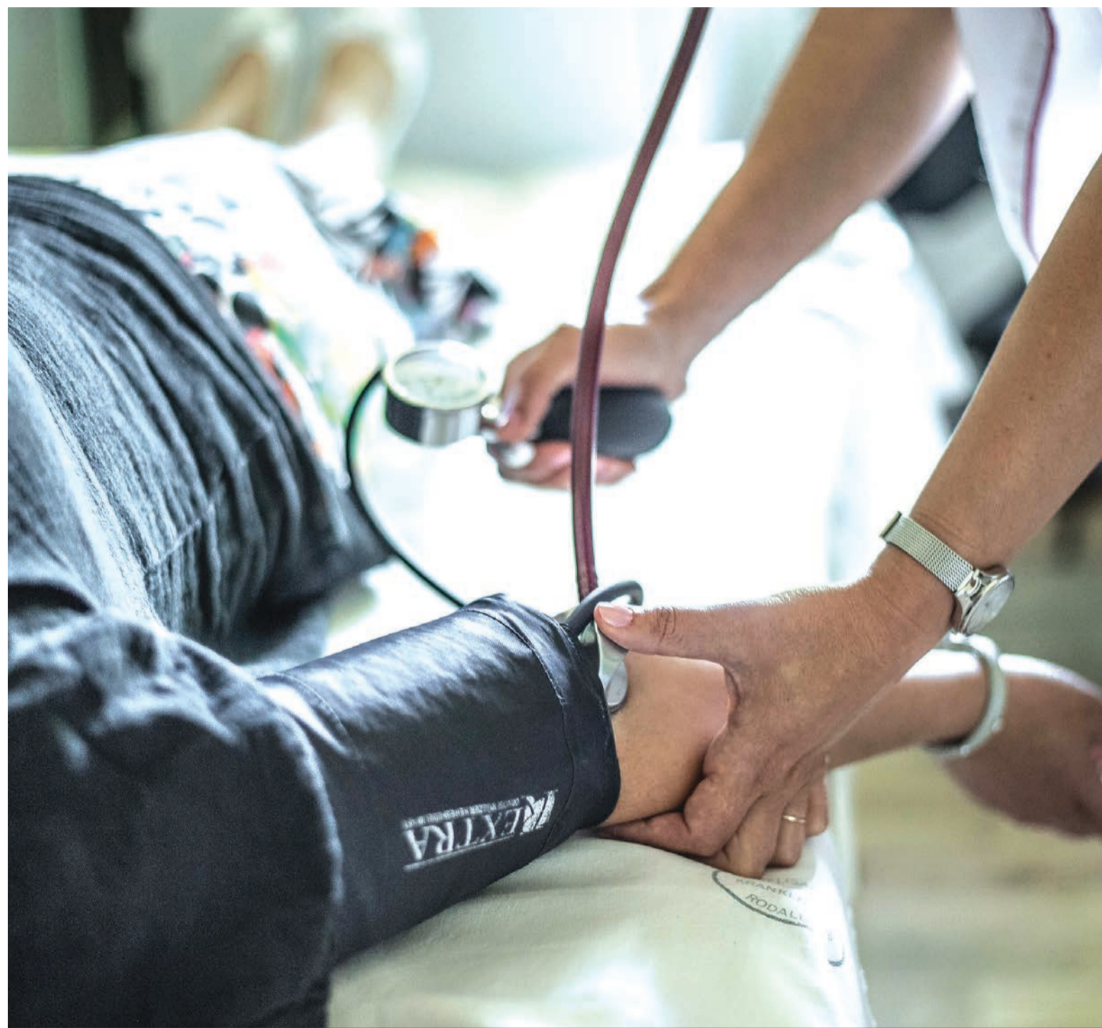
Január elsejétől a nem biztosítottak is ugyanolyan jogokat élveznek a háziiorvosnál, mint a biztosítottak ▲ KÉPÜNK ILLUSZTRÁCIÓ.

Januártól ingyenesek lesznek a háziiorvosi szolgáltatások