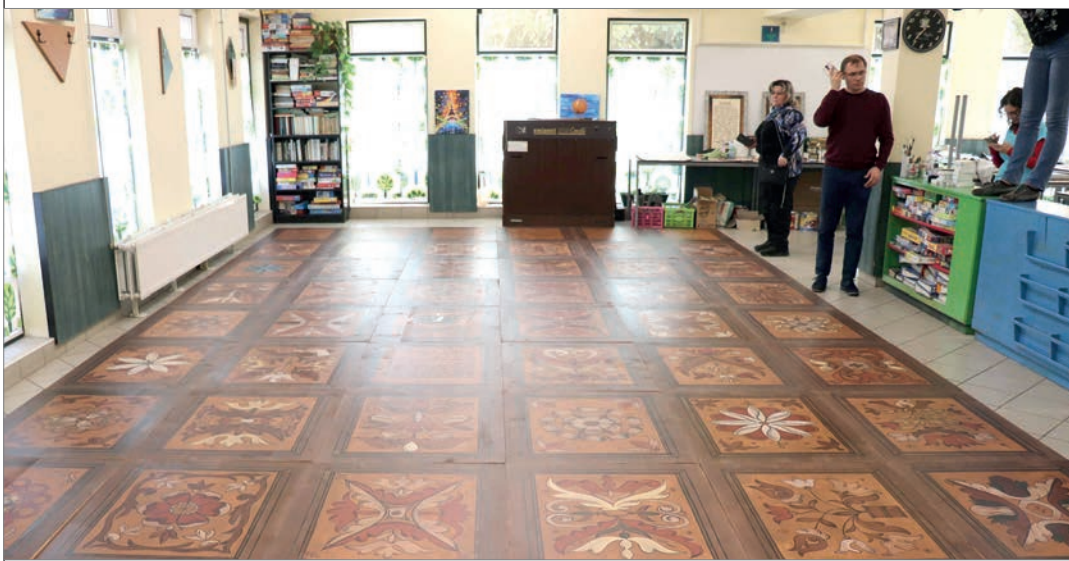
Magyarfülpös templomának 1642-es kazettáiból kevés maradt meg, rajz alapján rekonstruálták