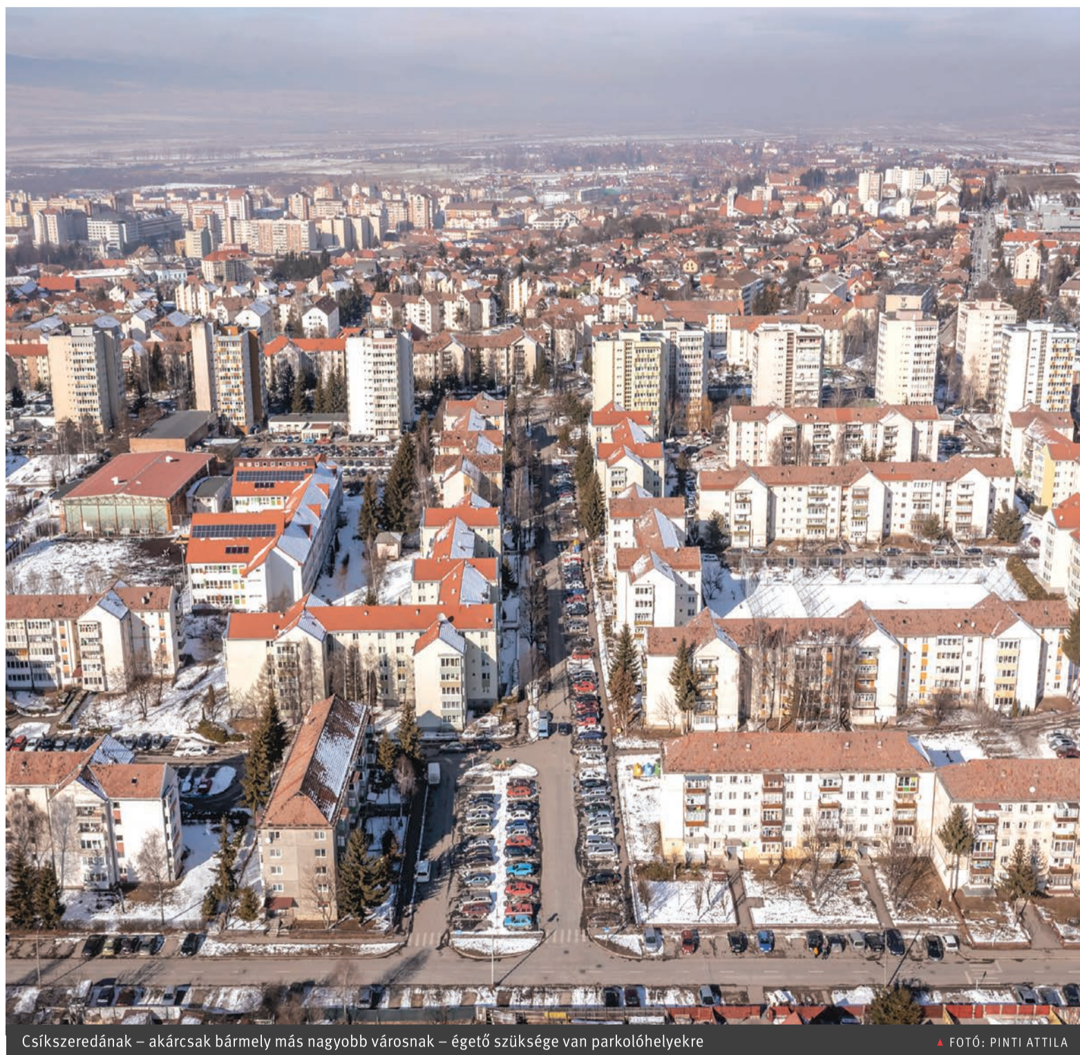
Csíkszeredának – akárcsak bármely más nagyobb városnak – égető szüksége van parkolóhelyekre

Parkolóház és mélygarázs épülhet Csíkszeredában