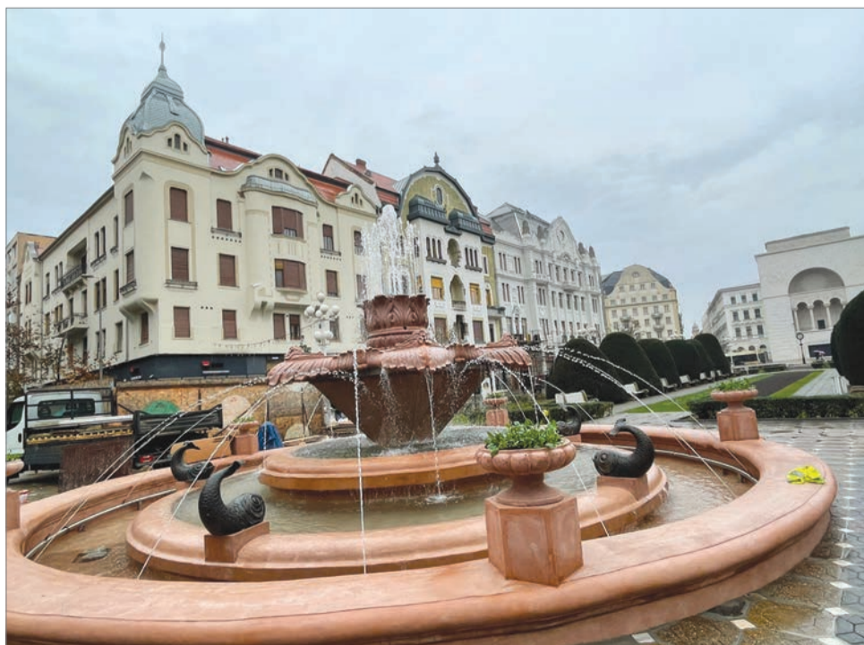
A kulturális fővárosi címre tekintettel az Opera tér is ünneplőbe öltözik Temesváron jövőre

Mint ismeretes, Temesvár eredetileg 2021-ben lett volna Európa kulturális fővárosa, azonban a koronavírus-járvány és a helyi intézmények felkészületlensége miatt jövőre halasztották a projektet. A bánági városban számos vita és botrány előzte meg az európai szintű rendezvénysorozatokra való felkészülést, a címre egyébként román részről Kolozsvár is pályázott, de a temesváriaké lett a nyertes projekt.