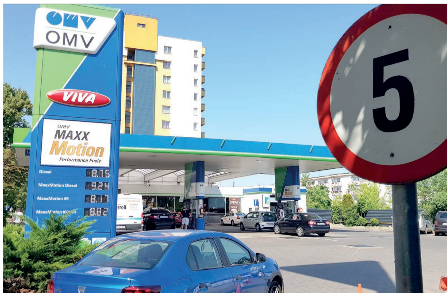
KÉPUNK ILLUSZTRÁCIÓ.

Öt székelyudvarhelyi kulturális intézmény vezetősége döntött úgy, hogy hosszabb-rövidebb ideig bezárják kapuikat a közönség előtt – így szeretnének spórolni, mivel egyre növekszenek az energiaszámlák. A múvelődési ház, a városi könyvtár, a Haáz Rezső Múzeum, a Tomcsa Sándor Színház és az Udvarhely Néptáncműhely vezetősége úgy döntött, hogy december 24-e és január 9-e között nem fogad látogatókat. » 4.