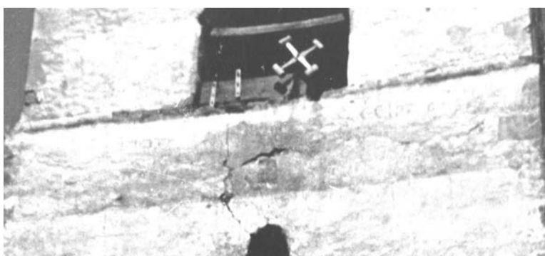
2. A torony