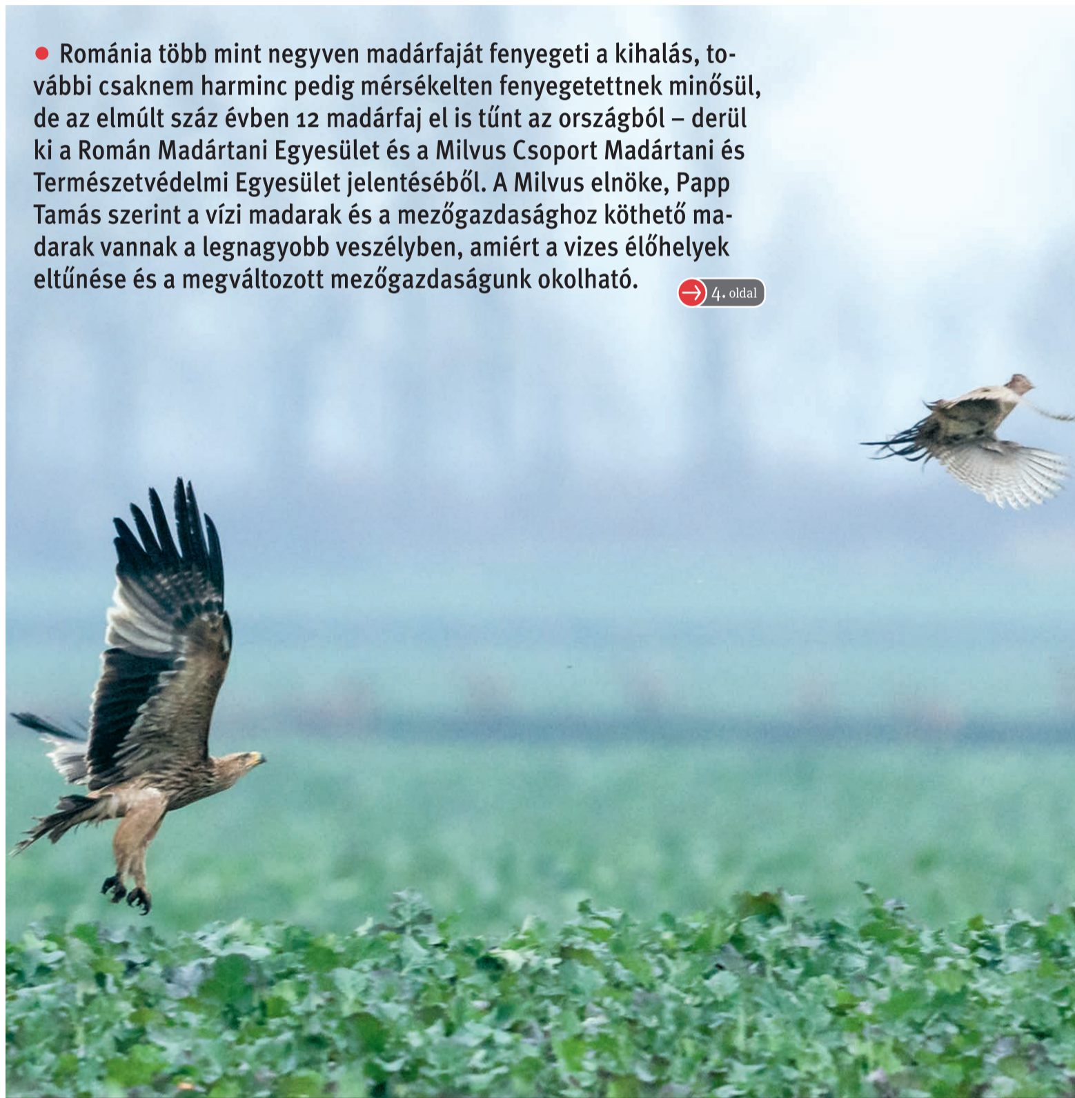
A vízi madarak és a mezőgazdasághoz köthető madarak vannak a legnagyobb veszélyben