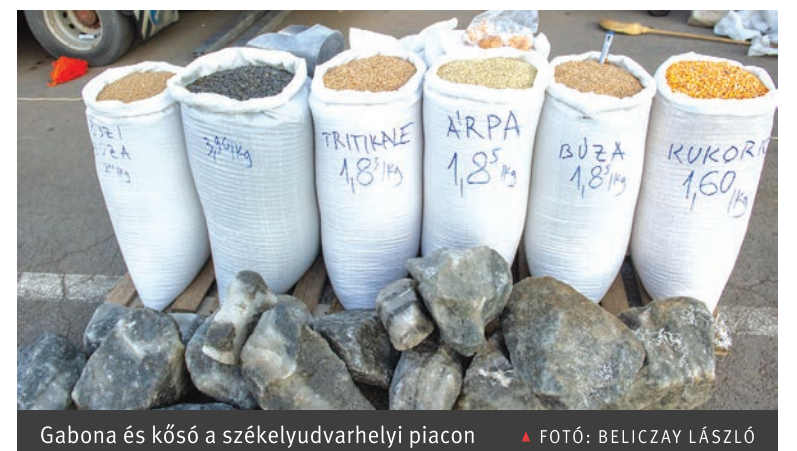
Gabona és kőst a székelyudvarhelyi piacon