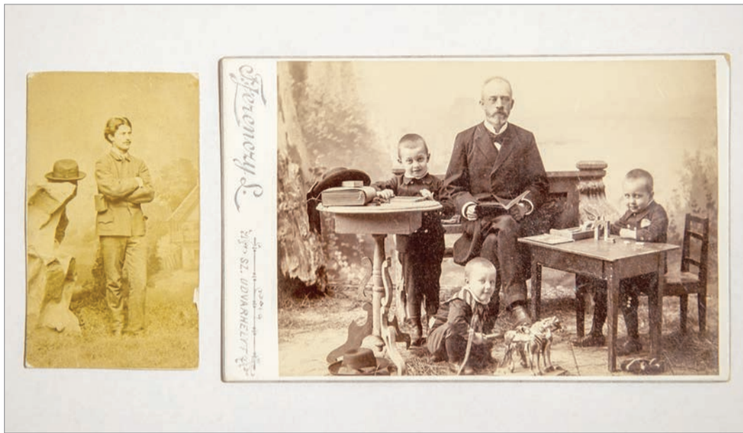
Helyi kuriózumnak számító régi fényképek is bekerültek az udvarhelyi múzeum gyűjteményébe

A múzeum csapata minden lehetőséget igyekszik kiaknázni,