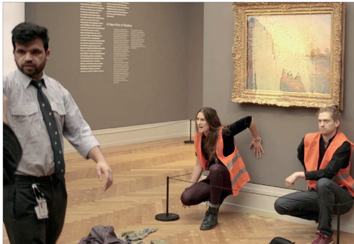
Aktivisták burgonyapürével öntötték le Claude Monet legmagasabb piaci értékű alkotását Potsdamban