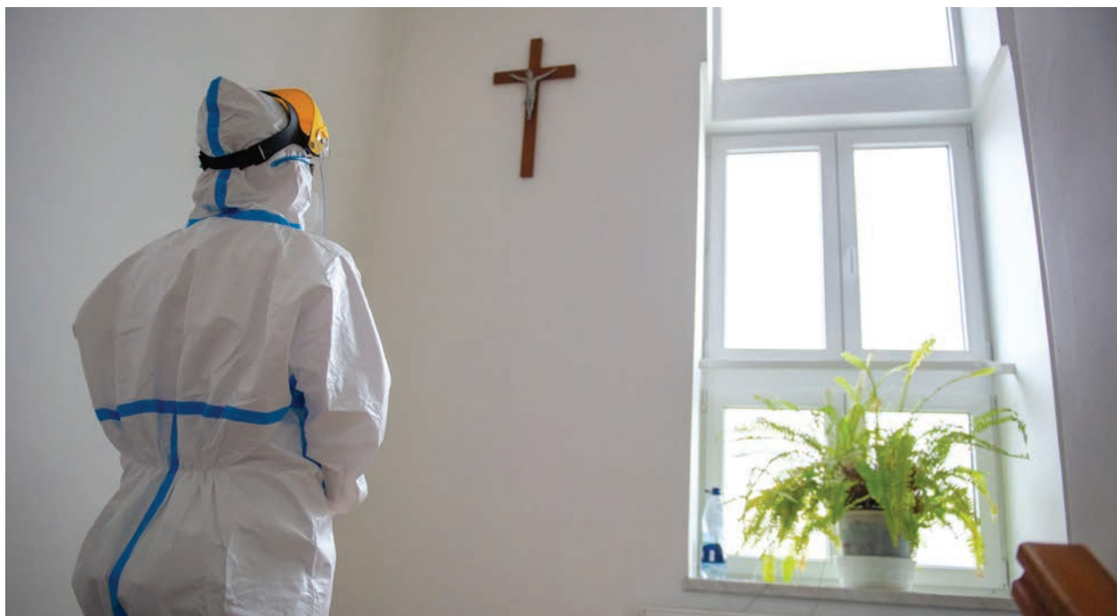
Fohászoknak alkalmazottak, betegek is