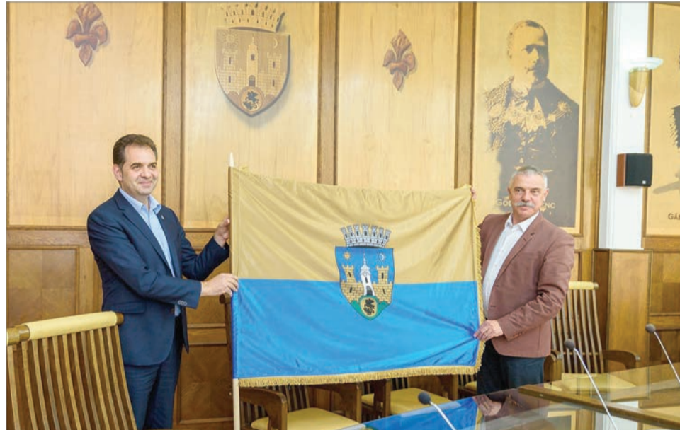
Sepsiszentgyörgy zászlója miatt is pert indított a Székelyföldön élő románok civil fóruma

Mihai Eminescu költőnek állítana szobrot Sepsiszentgyörgyön a Kovászna, Hargita és Maros megyei románok civil fóruma (FCRCHM) – ehhez területet és részfinanszírozást követelnek az önkormányzattól. Miután erre vonatkozó beadványukat közzétették, gyorsan a brassói székhelyű, hasonlóan magyarellenes Calea Neamului (Nemzet útja) elnevezésű szervezet is csatlakozott, levélben követelve a szoborállítást. Antal Árpád polgármester csütörtöki sajtótájékoztatóján kifejtette, nem tárgyal azokkal, akik a város érdekei és a magyar közösség ellen ügködnek, minden egyeztetés előfeltétele, hogy a román civil szervezet vonja vissza az általa elindított, ilyen tárgyú pereket. „Miután ezeket a pereket visszavonták, jöhetnek tárgyalhatunk az Eminescu-szoborról és másról is” – szögezte le a polgármester. A