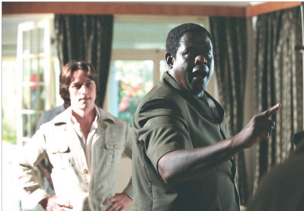
Az orvos Idi Amin afrikai diktátor kegyeltje lesz, azonban megismerve a valóságot, menekülni próbál

Kevin MacDonalddal skót rendező alkotása a thriller műfajának eszközeivel mutatja be az örült diktátor, Idi Amin (Forest Whitaker) uralma alatt álló Ugandát. A film a tényeket és a fikciót ügyesen ötvözve napjainkban is meglepően releváns történetet mesél el. A valós személyek és események inspirálta erőteljes dráma egy fiatal skót férfit, Nicholas Garrigan (James McAvoy) szemén keresztül mutatja be Amin hihetetlen történetét, aki a labilis természetű vezető személyi orvosává és legbelső bizalmasává válik.