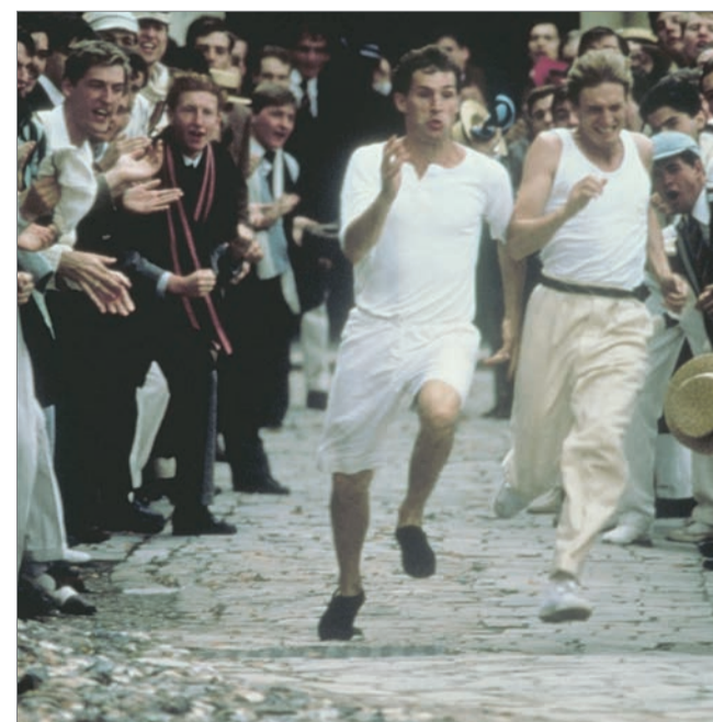
Két futó elszánt, bátor harca elevenedik meg a filmben

két csodás sportember elszánt, bátor harcát a személyes és az olimpiai diadalért. A film, amelyet átleng a húszas évek nosztalgijára, minden korosztály számára feledhetetlen élményt nyújt, amit megkoronáz Vangelis zenéje. Az 1981-ben készült Tűzszekerek című angol filmdrámát november 27-én este láthatják a Duna Televízió nézői.