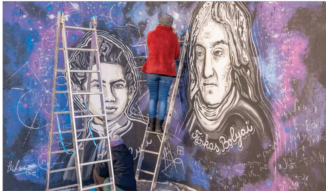
Megörökített nagyjaink. A két Bolyai portréja is látható egy tömbház falán Marosvásárhelyen