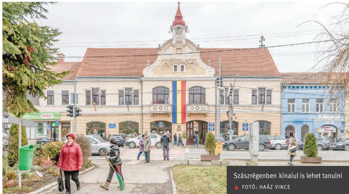
Szászrégenben kínaiul is lehet tanulni

A kínai nyelvtanulást az iskola vezetősége kezdeményezte, a tanulók pedig lelkesen fogadták, és többen is jelezték, hogy szeretnék megtanulni kínaiul. Ezt követően felkeresték a bukaresti kínai nagykövetséget, amely nyitottan viszonyult az ötlethez, azonnali segítséget ajánlott fel, illetve együttműködési szerződést írt alá a tanintézménnyel, hogy a tanév elején már indulhasson is a nyelvtanfolyam.