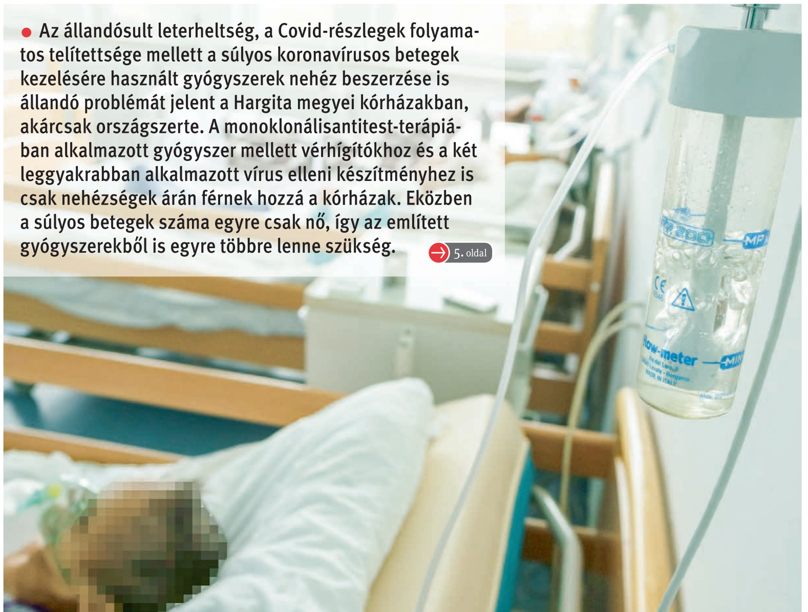
Nem mindig kapnak elég készítményt, ezért folyamatosan igénylik a szükséges gyógyszereket