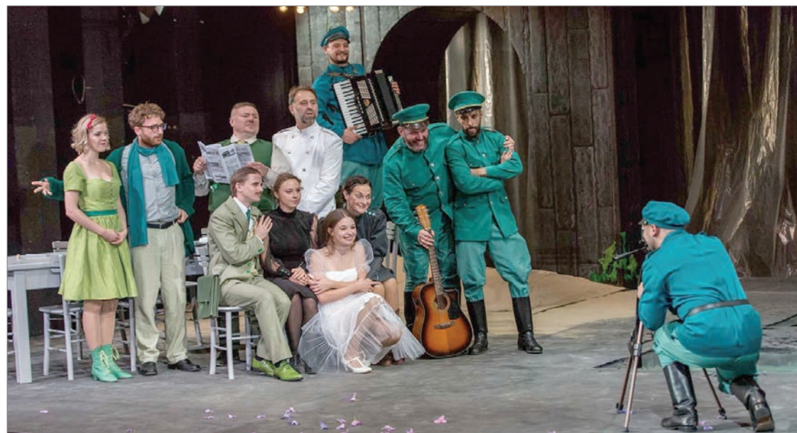
A Szabadkai Népszínház Három nővér című, Sebestyén Ába rendezte előadása nyitja a szemlét Brassóban

A kötelező egészségügyi előírások értelmében a termekben ötvenszázalékos telítettséggel játsszák az előadásokat, a nézők