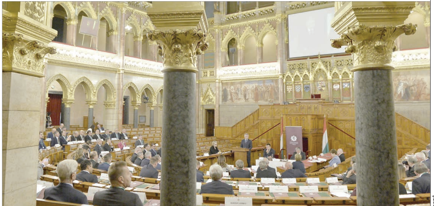
Kiállítás. Az ülés résztvevői szerint nem szabad figyelmen kívül hagyni az őshonos kisebbségeket

A szervezet üdvözi az Európa Tanács Miniszteri Bizottsága féléves magyar