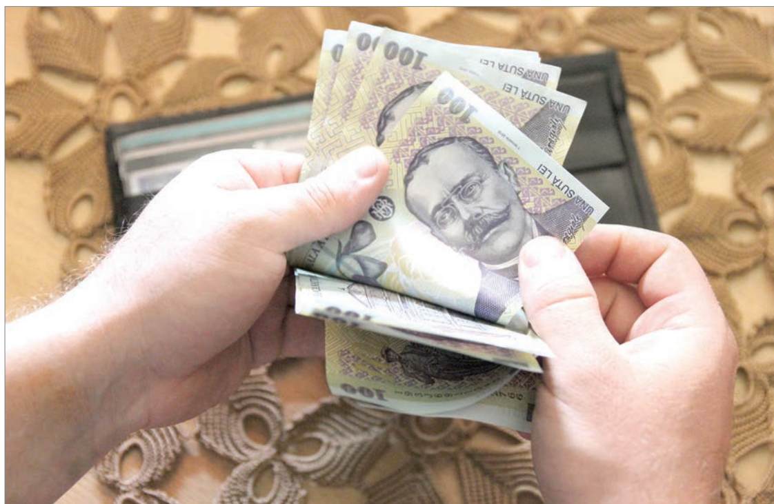
Kevesebből többet. Nem tudja tartani a lépést a béremelkedés üteme az inflációs rátával

Tavaly szeptemberhez képest a legnagyobb mértékben, 24,65