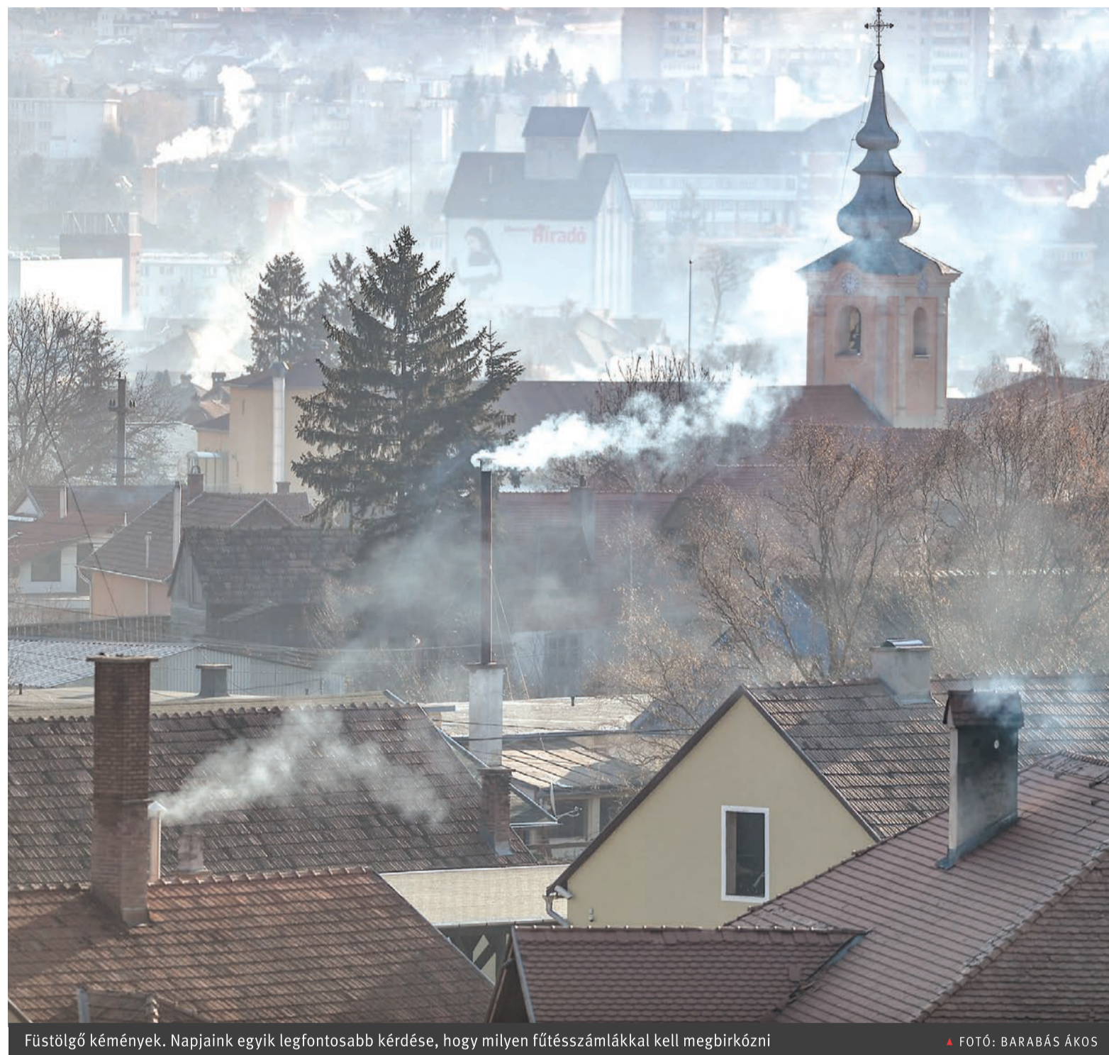
Füstölgő kémények. Napjaink egyik legfontosabb kérdése, hogy milyen fűtésszámlákkal kell megbirkózni

Energiaár-támogatást nyújtanak a lakossági fogyasztóknak