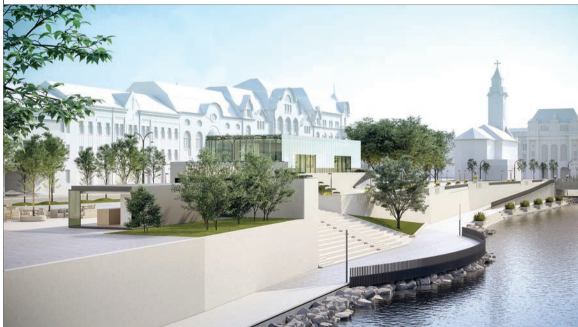
Térfoglalás. A Kossuth utcai tér kinézetéről a nagyváradi lakosság döntött

Az önkormányzat honlapján közzétett ismertető szerint a Muun Concept A. B. tervezőiroda a közeli szecessziós épületekkel, elsősorban a szemközti Fekete Sas Palotával összhangban dolgozza ki tervét. Egy szecessziós stílusjegyeket viselő üvegkupolát álmodott a belvárosba, melyet hasonló stílusú fémszerkezet tart. Az arany színű gránitburkolaton virág- és geometrikus minták utalnak majd a város fénykorára, míg az építményben állandó kiállítás mutatja be Nagyvárad épített örökségét. A tervnek padokkal ellátott terebélyes zöldövezet is része, a közeli Körös-parttal pedig lépcsők révén teremti meg a kapcsolatot. A projekt a nagyváradi magyarok körében is népszerű volt.