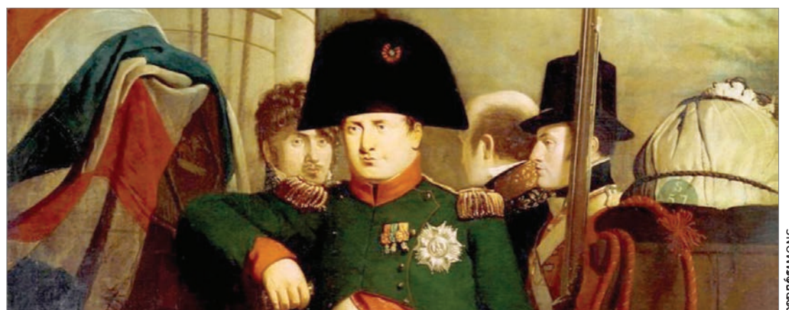
Rekordáron kelhet el Napóleon francia hadvezér egyik kalapja

az uralkodó emléktárgyaiból. A szakértők szerint Napóleon ezt a kalapot viselte, amikor I. Sándor orosz cárral