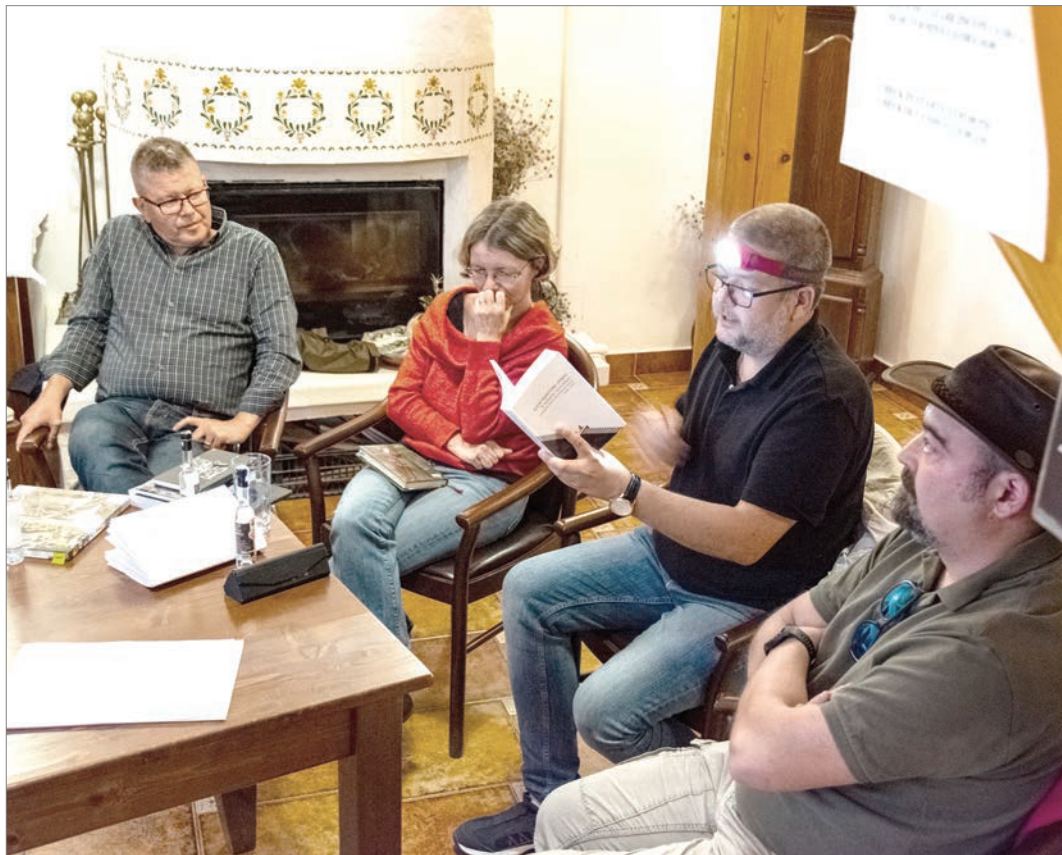
A klasszikus magyar és világirodalom vidékfogalmát is körbejárták az előadók az Erdélyi Magyar Írók Ligájának sztánai táborában