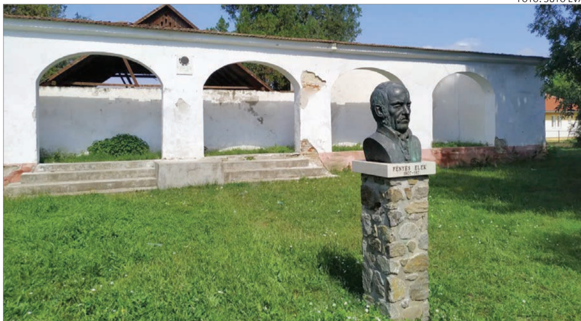
A Fényes-kúria manapság – a büszt Mihály Gábor alkotása

Talán a Bihar megyei Csokaly, a maga állandó változatlanságával adja vissza leginkább az érmelléki kistalpak múltban rekedt jellegét. A fűvel benőtt, de parknak nevezett egyetlen terecskéje is inkább