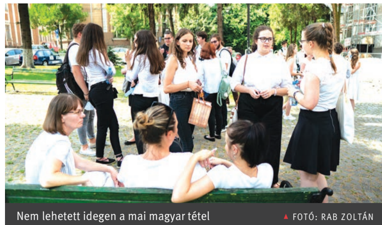
Nem lehetett idegen a mai magyar tétel

„A korábbi években sem panaszkodhattunk, remélem, most is jó eredményeket érnek el. Nem a mennyiség, vagyis az oldalszám határozza majd meg, hanem a minőség, hogy ki hogyan teljesített” – mondta az igazgató.