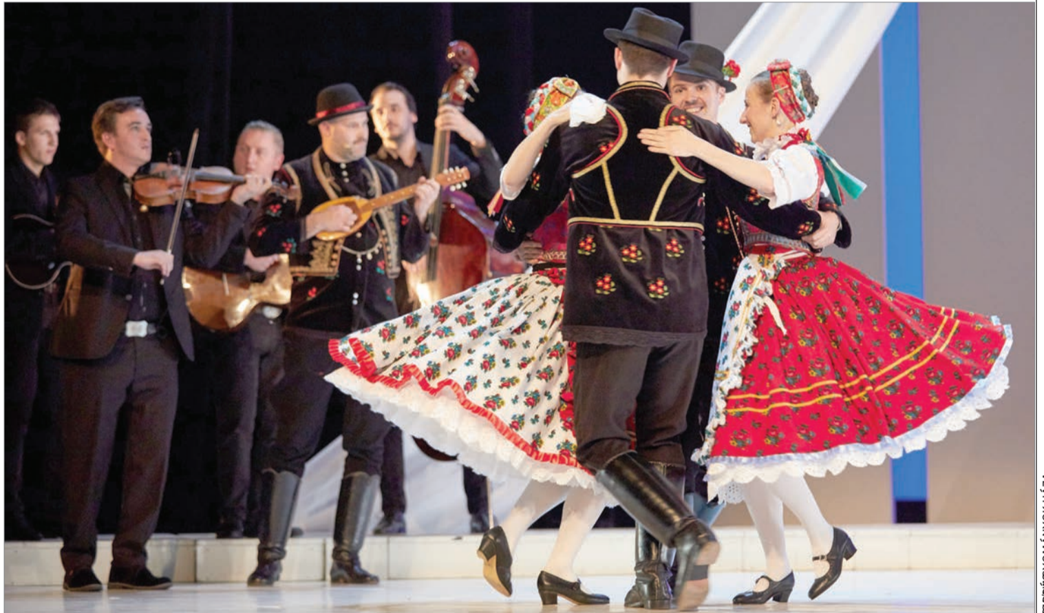
Különböző népek zenéit és táncait vonultatja fel a Magyar Állami Népi Együttes nagy sikerű előadásainak tematikus válogatása

A Kincses Felvidék című műsorával a formáció a magyarországi