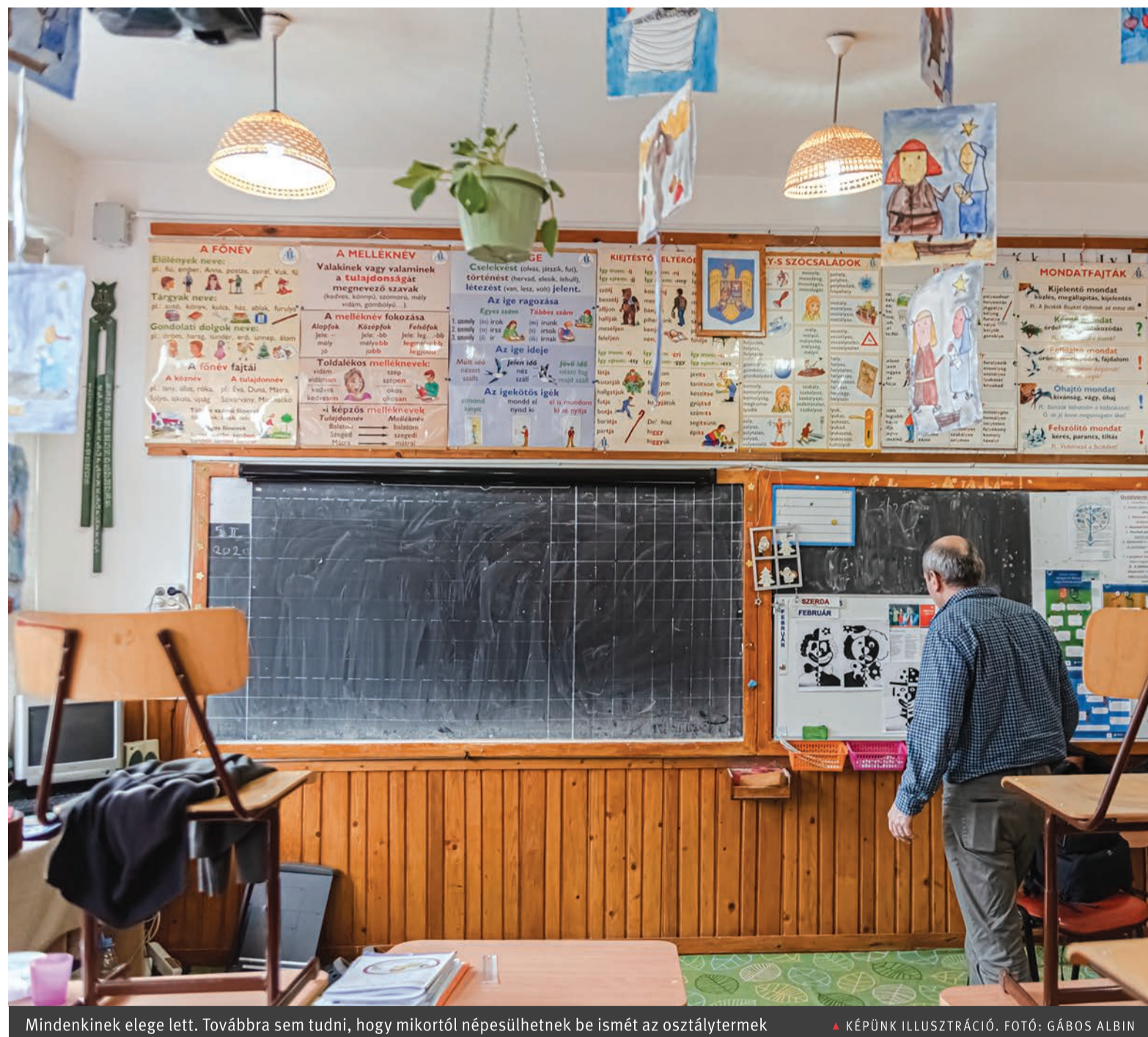
Mindenkinek elege lett. Továbbra sem tudni, hogy mikortól népesülhetnek be ismét az osztálytermek

Tanár, diák, szülő forgatókönyvek szerinti iskolakezdést kér