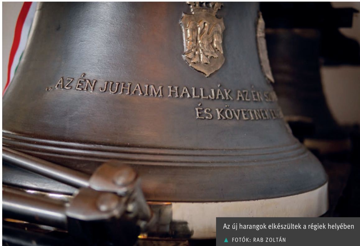
Az új harangok elkészültek a régiak helyében

● Egy februári hajnalon lángba borult a héderfáji harangláb, amely a falu legmagasabb pontján, a templomtól száz méterre állt évszázadokon keresztül. A harangok is odavesztek. Óriási lelki és anyagi kár érte a református egyházközséget. A magyar állam hamarosan felkarolta az ügyet, az új harangok új haranglábba várnak.