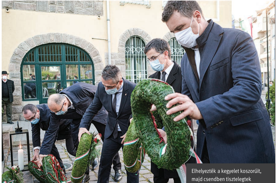
Elhelyezték a kegyelet koszorúit, majd csendben tisztelegtek a forradalom hősei előtt