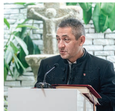
Potápi aláírásra buzdított

ad arra, hogy megfogalmazzuk kéréseinket az autonómia kapcsán, hogy kifejezzük, mi is részesei vagyunk a világnak” – mutatott rá az államtitkár. Hozzátette: ennek érdekében a nemzeti régiókért indított európai polgári kezdeményezésre egymillió-kétszázötven ezer aláírás ugyan összegyűlt a májusi határidőig, de az országokra lebontott kvóták nem mindenhol érték el a küszöböt. „Bár Romániában, Szlovákiában és Magyarországon összegyűlt a szükséges aláírás, arra kérem önöket, főként a Nyugat-Európában élő ismerőseiket,