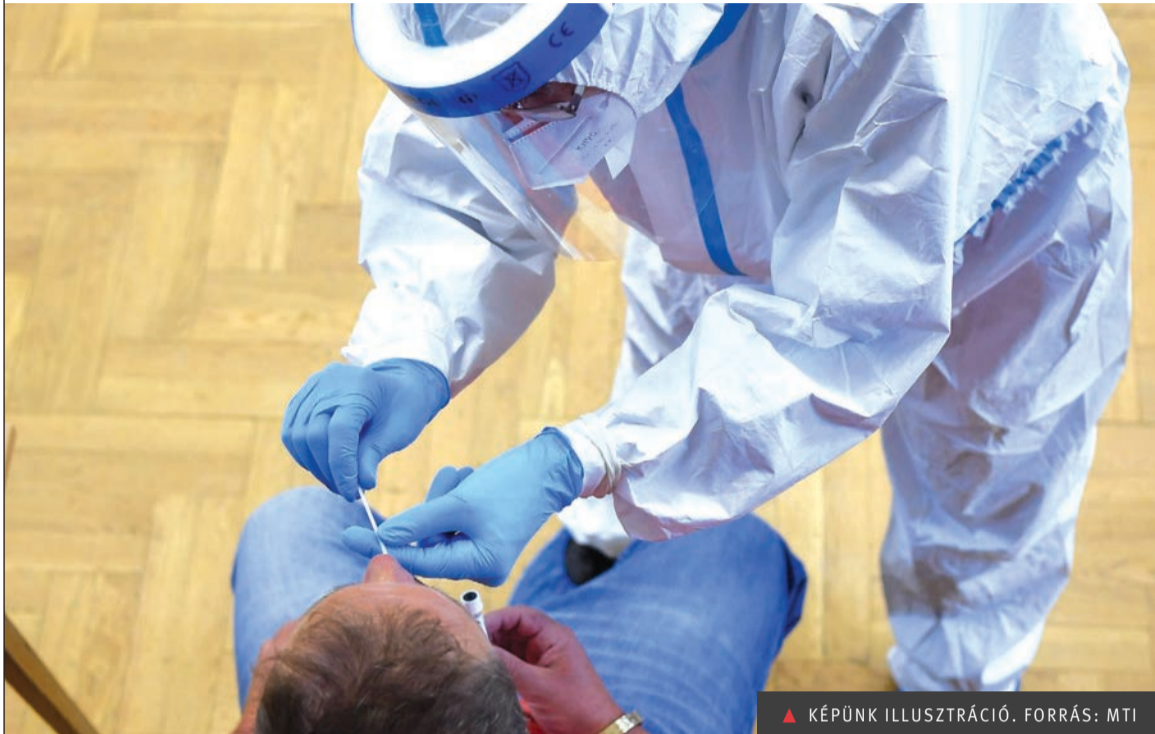
▲ KÉPÜNK ILLUSZTRÁCIÓ.

Ahol fontos lenne a tesztelés, ott nem kérik