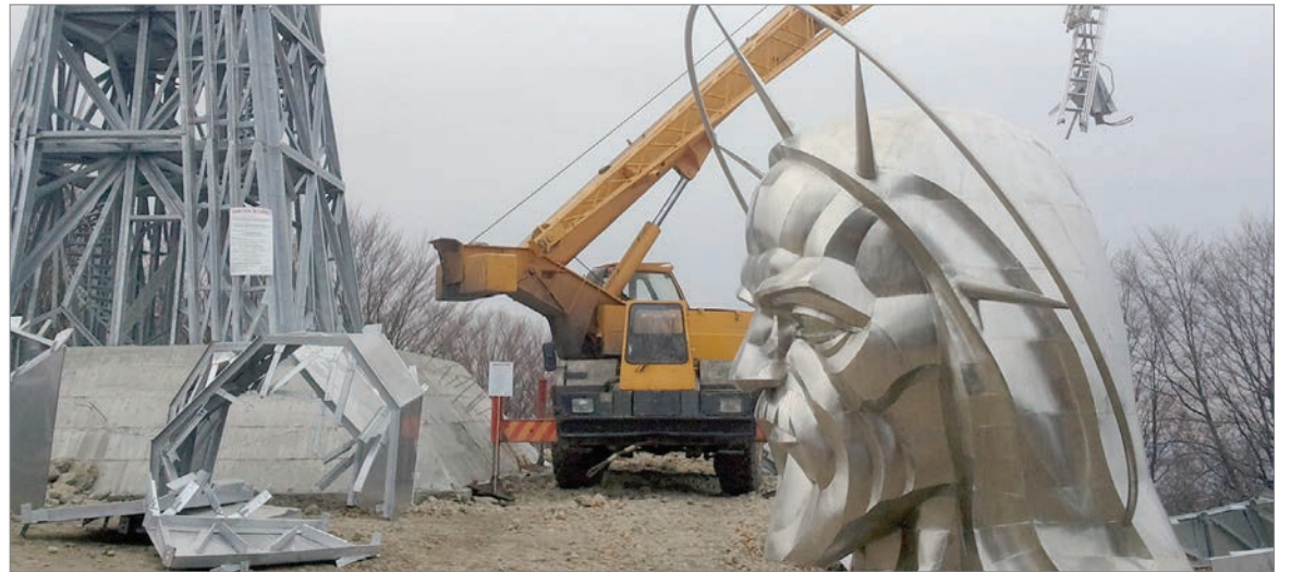
Kirakós. 2012 decemberében a szobor már a Gordon-tetőn épült

a szobor tetejéből a glóriára. Valószínűnek tartom, az illető nem volt tudatában, hogy a glória valójában csak díszelem, így nem többletterhelésre volt tervezve. Szerencsére annyira erősen rögzítették, hogy nem szakadt le az ember alatt. „Ha pléhből lett volna, ahogy a rossz nyelvek mondják, akkor az illető glóriástól zuhant volna le húsz méter magasból” – figyelmeztet a szobrász. A lépcsőszerkezet végig úgy van kialakítva, hogy biztonságos legyen, sem kiesni, sem kimászni nem lehet. Ezt tapasztaltam én is, amikor felmentem a kilátó tetejére. Habár tériszonyom van, mégis biztonságosnak éreztem a kialakított csigalépcsőket és a körülöttem lévő rácsszerkezetet, a kilátás pedig magáért beszél. A Fogarasi-havasokon kívül belátható a Hargita- és a Persány-hegység, a Cekend-tető, a Rez-tető, valamint Udvarhely-