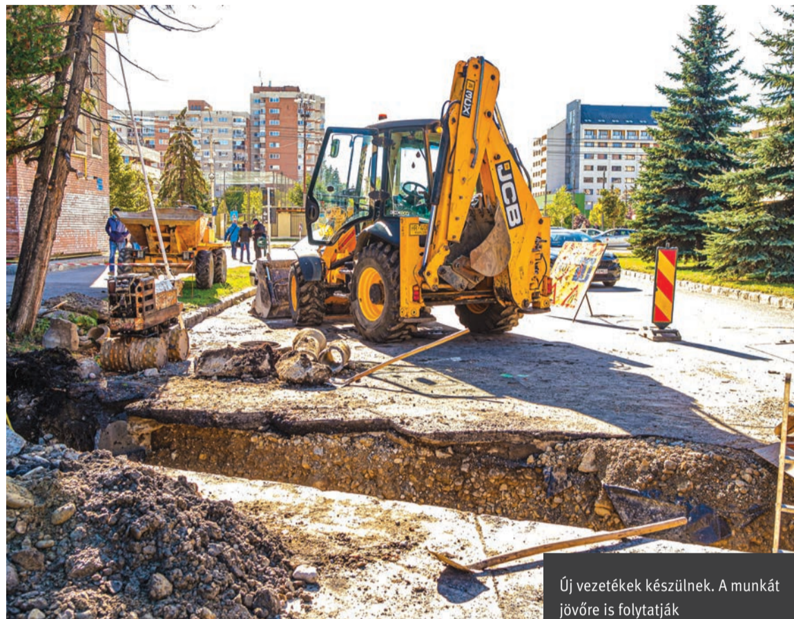
Új vezetékek készülnek. A munkát jövőre is folytatják