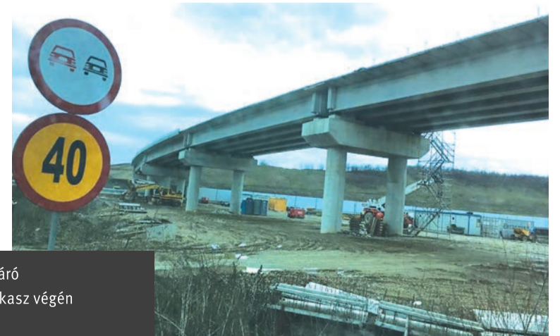
Dolgoznak rajta. Készül a vasúti felüljáró Radnót határában, a már meglévő szakasz végén

autópálya Marosvásárhely–Aranyosgyéres közötti szakaszát több részre osztották: Marosvásárhely–Nyárádtő, Nyárádtő–Radnót (ezen már lehet közlekedni), Radnót–Maroskece és Maroskece–Aranyosgyéres. Ami a Marosvásárhely és Nyárádtő közötti pályaszakasz megépítését illeti, a CNAIR igazgatója azt mondta, előre láthatóan január végéig az illetékes bizottság bírósági döntés alapján ki fogja jelölni a nyertes kivitelezőt.