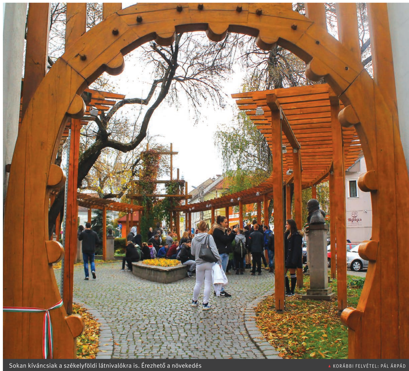
Sokan kíváncsiak a székelyföldi látványokra is. Érezhető a növekedés

A két székely megye átlag feletti szinten teljesített