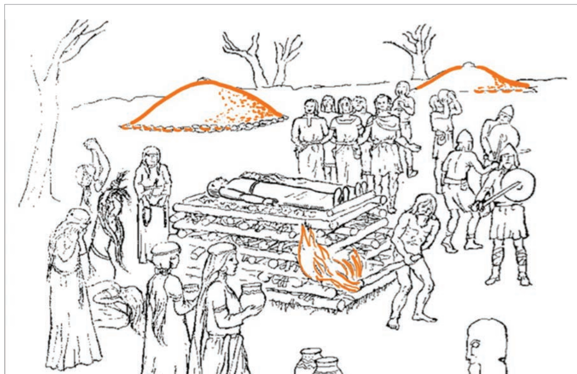
A szláv lakosság halottait elhamvasztotta, és a temetkezései fölé kisebb halmokat emelt

A szerző régész, a Magyar Nemzeti Múzeum főigazgató-helyettese, a kiállítás kurátora