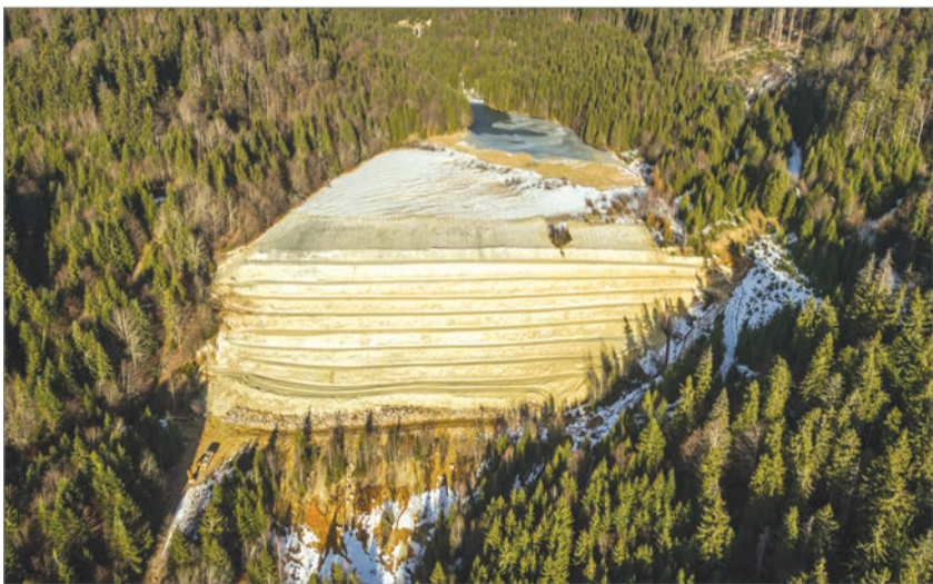
A hargitafürdői zagytározót lezáró lépcsőrendszer a beavatkozás után

ban ennek lehetősége az időjárástól, a csapadék mennyiségétől is függ. „Azt nem tudjuk megmondani, hogy ez az állapot hány évig marad fenn, de ami minket illet, igyekeztünk úgy dolgozni, hogy a helyreállítás időálló legyen” – összegzett. A korábban Hargitafürdőn kaolinkitermelést végző bányavállalat csődje után a létesítmény jelenleg egy Kovászna megyei felszámoló cég tulajdona, a javítókat utóbbinak kellett elvégeznie. A mostani sürgősségi beavatkozásról egy idén elvégzett szakértői vizsgálat után döntöttek, amely a tározó gátjának állapotát veszélyesnek minősítette. Vízügyi szakemberek korábban arra hívták fel a figyelmet, hogy ha a 2-es számú tározó tartalma, a felgyűlt 3 millió köbméternyi savas hatású üledék a völgybe csúszik, jelentős környezeti károkat okozhat, előnthei az üdülőtelepre vezető megyei utat, a növényzetet, belekerül a patakokba, egészen a Csíkszereda és Székelyudvarhely közötti 13A jelzésű országútig juthat. Az egyelőre nem ismert, hogy milyen összegbe kerülne a két zagytározó felszámolása és a terület rendezése, illetve hogy ki biztosítaná az ehhez szükséges pénzt.