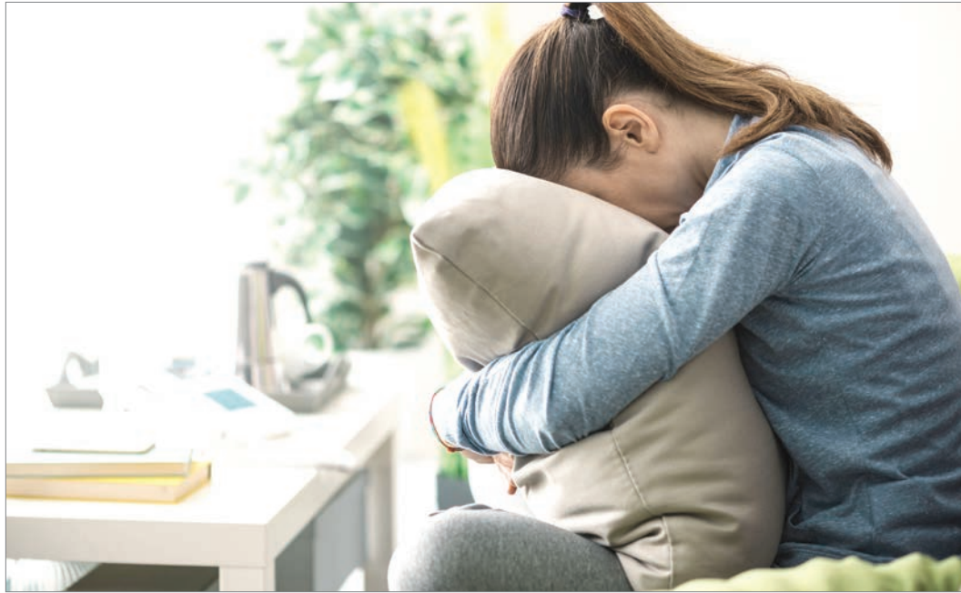
Levegővétel. Érintettek szerint a depressziót is hatékonyan kezelni lehet hipnoterápiával

hipnoterápiának vagy tudatalatti terápiának nevezett gyógymód segít az önfeltárában és az öngyógyításban, ugyanakkor egy nagyszerű felderítő módszer a tudatunk titkaira és a tudatalatti univerzumára. A Kaliforniában élő és dolgozó orvosnő szerint a hipnoterápiával a depresszió kivül az alkoholfüggőséget is hatékonyan lehet kezelni, ugyanakkor a túlsúlytól is meg lehet szabadulni. Állítása szerint volt betege, aki a rákból gyógyult ki.