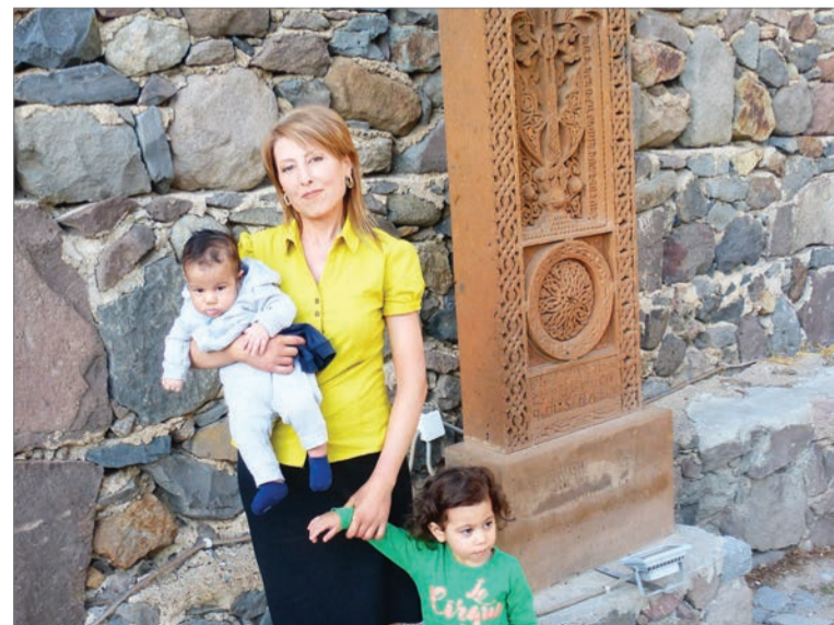
Egy örmény család a Geghard kolostor kőkeresztje előtt