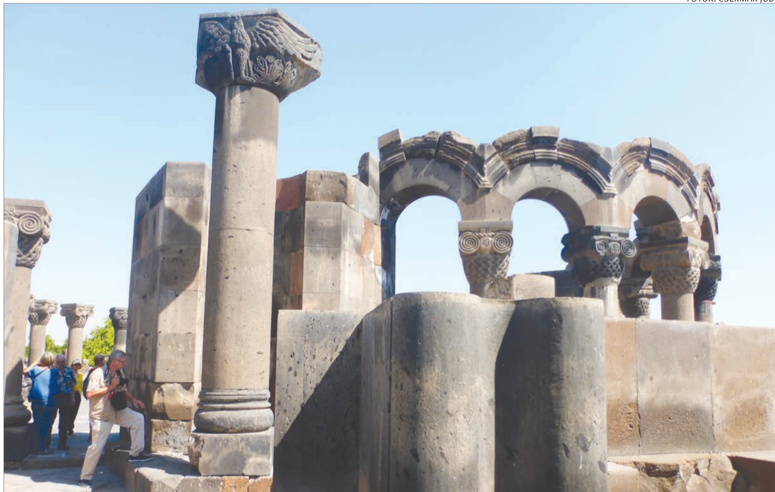
Zvartnoc templomának romjai turisták ezreit vonzzák Örményországban

Örményország középkori keresztény kolostorai, templomai az építészettörténet és a művelődéstörténet remekei. Több közülük a világörökség listáján is szerepel.