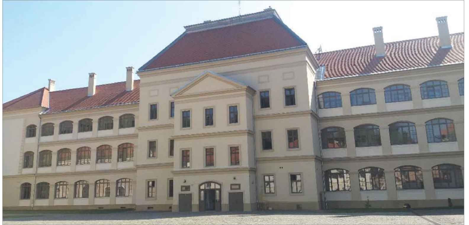
A felújított Bethlen Gábor Kollégium főépülete az iskola udvaráról

Még szerencse, hogy sikerül uniós pénzt lehívni, az enyedi hét pályázatát fogadta el az Európai Unió. Van, ami a városházi ügyfélfogadás hatékonyabbá tételére vonatkozik, de szociális jellegű is akad. A Máltai Szeretetszolgálat közösen elnyert terv keretében felújítanak egy önkormányzati