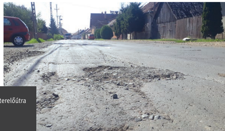
Ráfér a felújítás a gyergyószentmiklósi terelőútra

oldalon járdát építenek, valamint kerékpársávot és nyolc parkolóhelyet is létrehozna, a Halászok és a Békény utcában pedig járda készül és aszfaltolás lesz. Az útszakasz teljes hosszában megoldják az esővíz-elvezetést is. A víz- és csatornahálózaton a csikszere-dai Hidrotran nevű cég fog dolgozni.