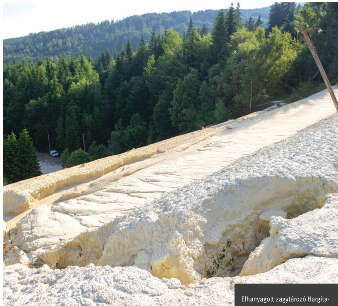
Elhanyagolt zagytározó Hargita-fürdőn. Sürgős a beavatkozás