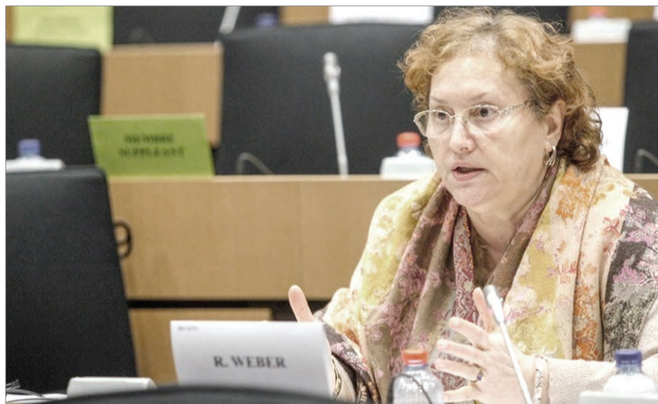
Renate Weber ombudsman szerint a kormánykontrollt akar gyakorolni a parlament fölött

Hasonló érvekre alapozva tiltakozott júliusban Klaus Johannis jobboldali államfő és a jobbközép ellenzék is az ellen, hogy a szociáldemokrata kormány a parlamentet megkerülve, a rendkívüli helyzetekre kitalált – a parlament által utólag megvitatandó – sürgősségi rendelettel emelte törvényerőre a 17 korábbi jogszabály rendelkezéseit összehangoló, a központi és