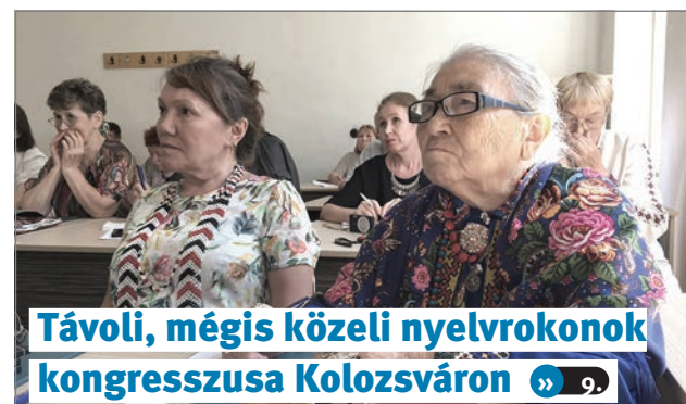
Távoli, mégis közeli nyelvrokonok kongresszusa Kolozsváron » 9.