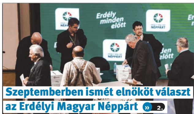
Szeptemberben ismét elnököt választ az Erdélyi Magyar Néppárt » 2.

Bár számos hivatalos intézmény, közműveltség ígért segítséget a tavaly ilyenkor leégett nagyváradi görögkatolikus püspöki palota felújításához, nem tartották be ígéretüket. Így az önkormányzat kénytelen saját forrásokra alapozni, és önerőből végezni a helyreállítást – írta Ilie Bolojan polgármester a Facebook közösségi oldalon annak kapcsán, hogy vasárnap volt egy éve, hogy leégett a Nagyvárad főterét díszítő értékes épület. » 3.