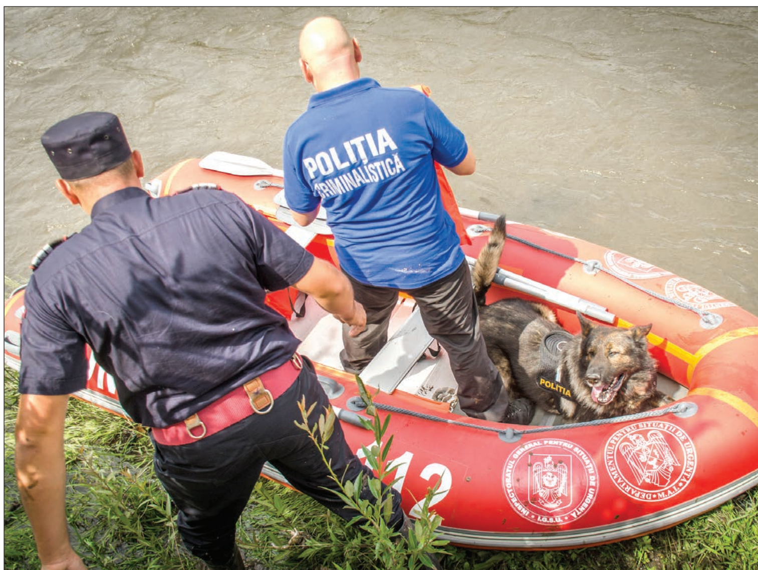
Sohasem lehet tudni. A hatóságok hamis riasztás esetén is kénytelenek nagy erőket mozgósítani

Elkeseredett felhívást fogalmazott meg a rendőrség: arra kéri a lakosságot, vessenek véget a 112-es sürgősségi hívószámra érkező hamis riasztásoknak. Az elmúlt időszakban – a caracali tragédia után – korábban soha nem tapasztalt mértékben emelkedett a hamis hívások száma. A legtöbb esetben az átverő azt jelenti, hogy emberrablás áldozata, hogy akarata ellenére fogva tartják. A kormány szigorítani szeretné a hamis riasztások miatt kiróható büntetést. A Krónika által megszólaltatott pszichológus szerint kiegyensúlyozott ember fejében meg sem fordul, hogy ilyesmivel szórakozzék. » 4.