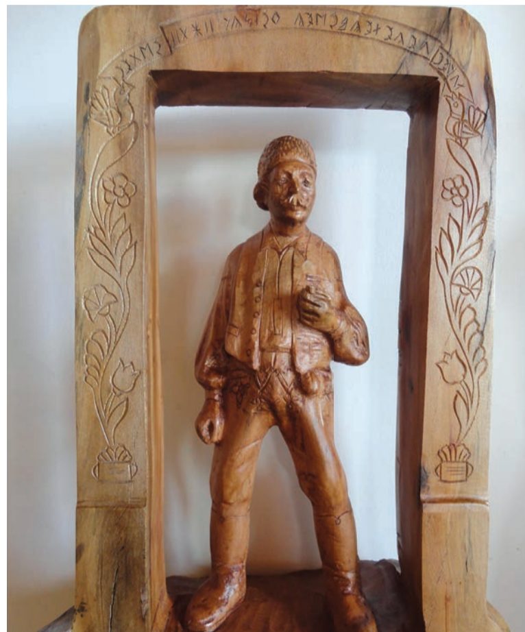
Kapuban - platánfa