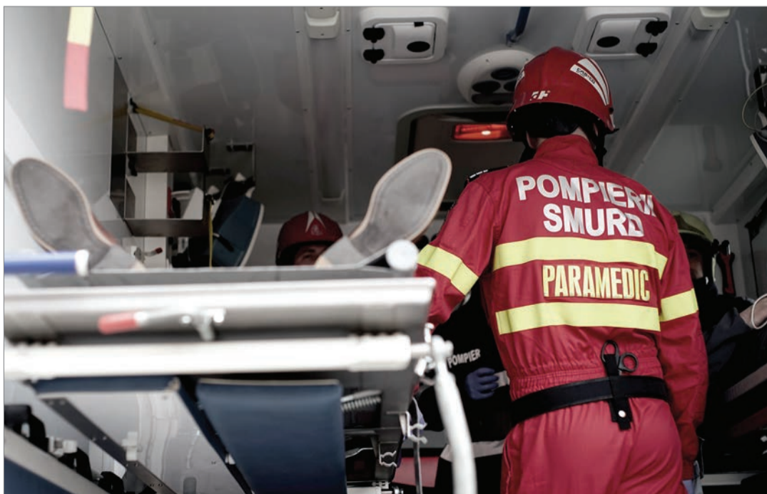
Ki kell fizetni. A katasztrófavédelem szerint másoktól is elkéri a „benzinpénzt”

Mint ismeretes, 2018. október 30-án három éve annak, hogy a bukaresti Colectiv klubban tűz ütött ki. A helyszínen 26 fiatal vesztette életét, a kórházban elhunyt áldozatokkal együtt azonban összesen 64-en haltak meg, köztük művészek, újságírók, olimpiakonok és egyetemi hallgatók. Később, egy évvel és kilenc hónappal a tragédia után még egy fiatal életét vesztette, így ez a szám 65-re nőtt.