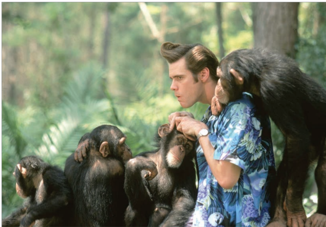
Kupaktanács. Ace Ventura afrikai mentőakciójában többek között a majmok lesznek segítségére

Eltűnt a kis házi kedvence? Kutyus, cicus, aranyhal, krokodil, tarantula, denevér? Forduljon a világ legjobb állatnyomozójához, Ace Venturahoz! Ő garantáltan előkerít minden négylábú, szárnyas, uszonyos vagy egyéb teremtményt. Ace igazi ász: frizurája bohókás, öltözké extrém, kajája meg leginkább madáreledel. Amikor „lába” kél Hópihének, a miami sportklub kabaladelfi nének, Ace frenetikus energiával veti magát a nyomozásba. Kamatoztathatja különleges adottságát: ott is nyomra bukkan,