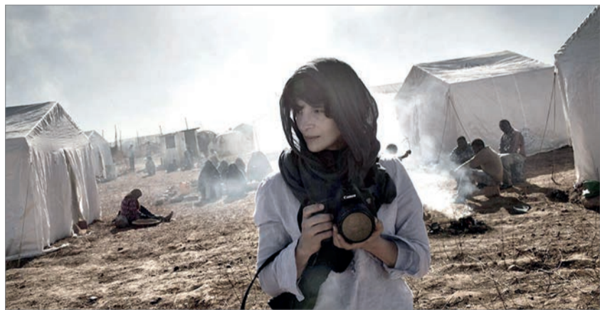
Juliette Binoche játssza a főszerepet a többszörösen dínyertes filmalkotásban

Rebecca (Juliette Binoche) háborús fotográfus. Családja Norvégia-ban él, Marcus (Nikolaj Coster-Waldau) a férje, és két lány édesanyja. Rebecca az egyik bevetésénél súlyos