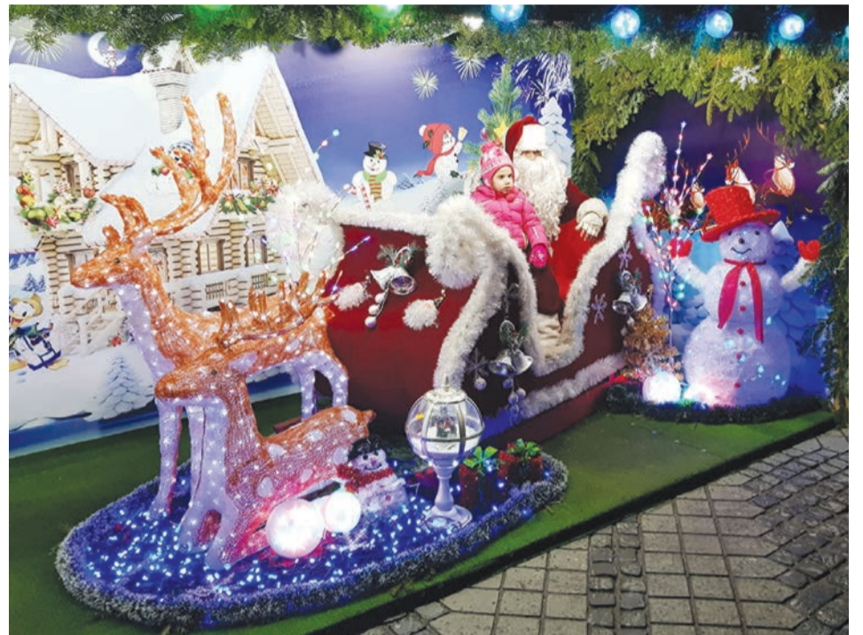
Mikulás nélkül nem vásár a vásár