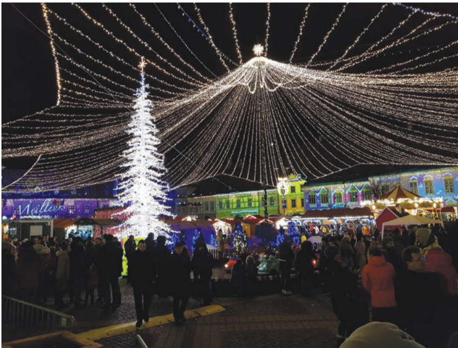
Bár sokan megfordulnak esténként a főtéren, nincs zsúfoltság

A Székelyföldről két-három órányi autózással elérhető egykori szász szabad királyi város megér egy estét, de akinek erre nincs idén lehetősége, képriportunkkal vigasztalódhat.