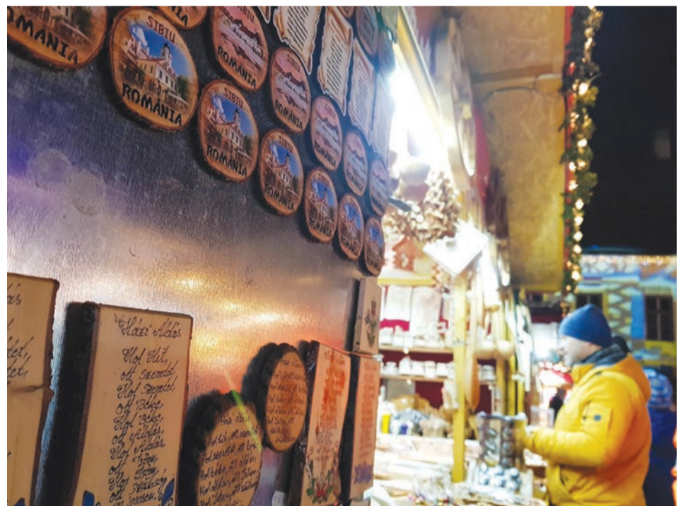
Igen, magyarul is hazavihetjük Szebenből a házi áldást