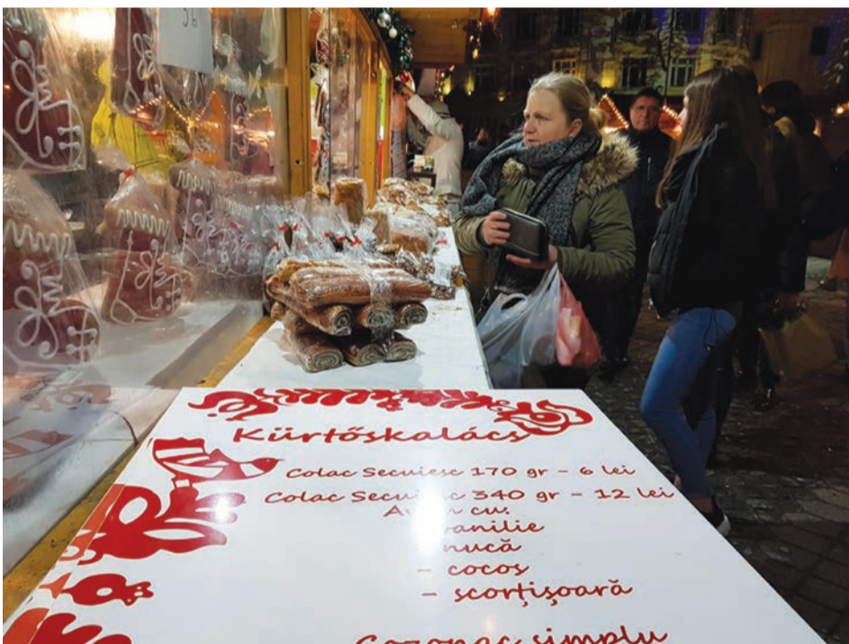
A kürtőskalács sem drágább, mint Székelyföldön