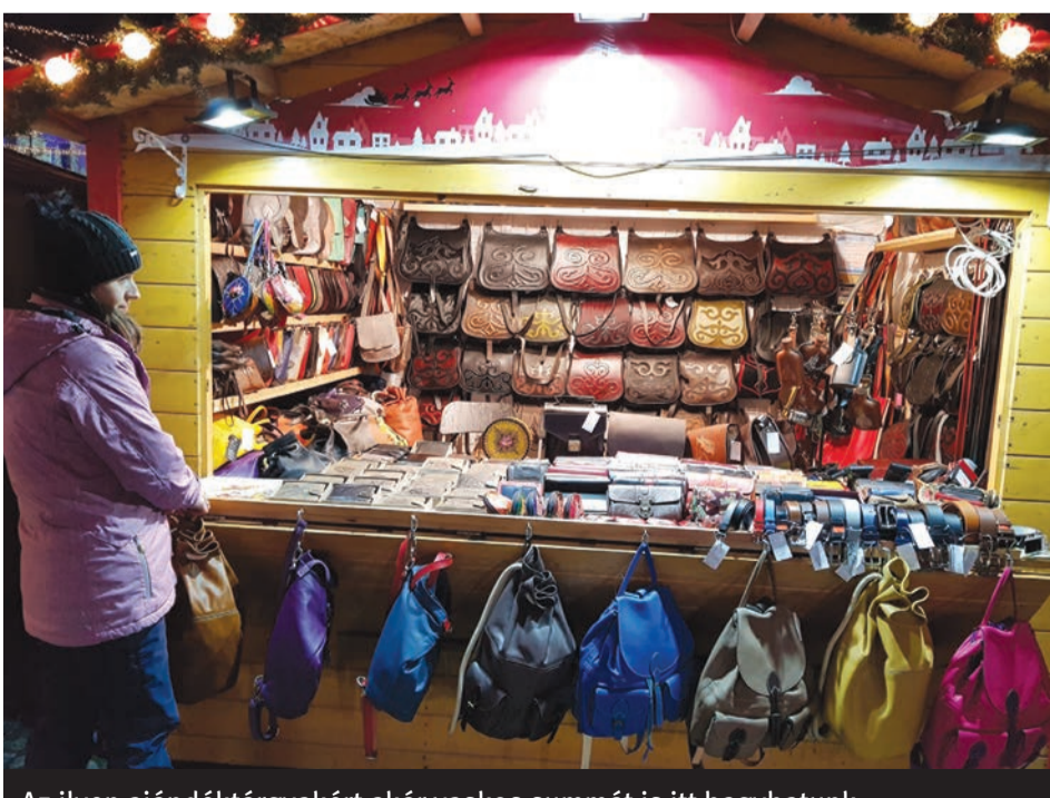
Az ilyen ajándéktárgyakért akár vaskos summát is itt hagyhatunk