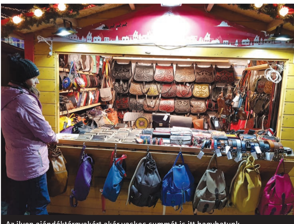
Az ilyen ajándéktárgyakért akár vaskos summát is itt hagyhatunk