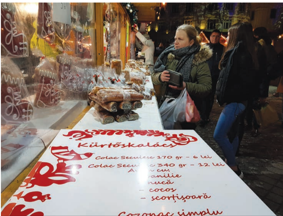
A kürtöskalács sem drágább, mint Székelyföldön