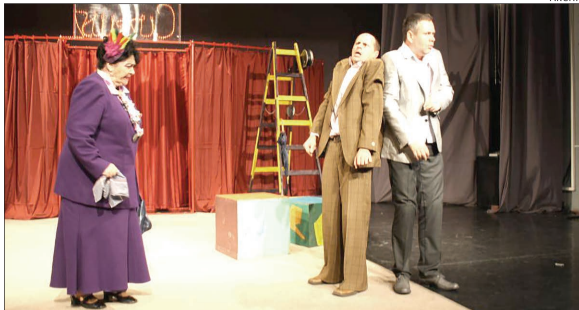
Jelenet a marosvásárhelyi Hahota színtársulat 2013-as Kész Cirkusz! című zenés szilveszteri kabaréjából

A kabaré 1901-ben jelent meg Budapesten, majd 1907-re ki is alakult a jellegzetes „pesti kabaré”. Kosztolányi Dezső a Nyugatban 1915-ben publikált cikkében pontosan érzékelt a magyar kabaré különleges mivoltát. „Azóta a pesti kabaré polgárvá vált, leiggadt, stílust kapott. Szerencsé-