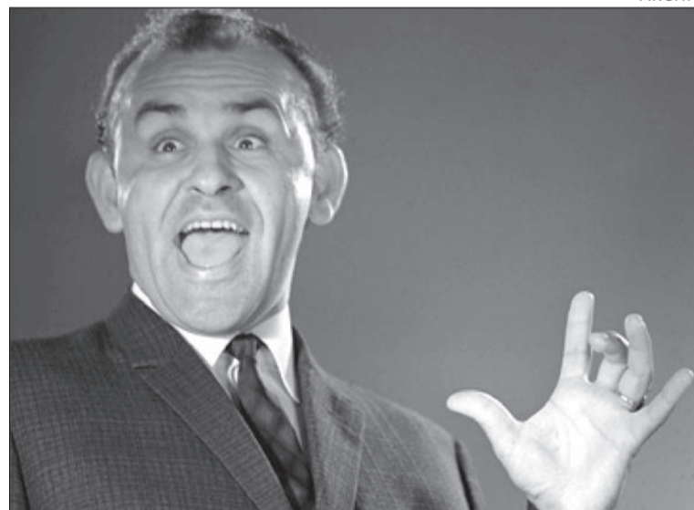
Hofi Géza egyszemélyes kabaréja műfajt teremtett Magyarországon

fordulatok, szürreális, gyakran kispolgári figurák és a társadalom fanyar humorba csomagolt kritikája jellemezte. Soha addig nem volt Rejtőnek akkora sikere, mint kabaréjeleneteivel. A Tévedésből jelentik posztumusz kötet (1988) több mint 120 kabaréjelenetét, bo-