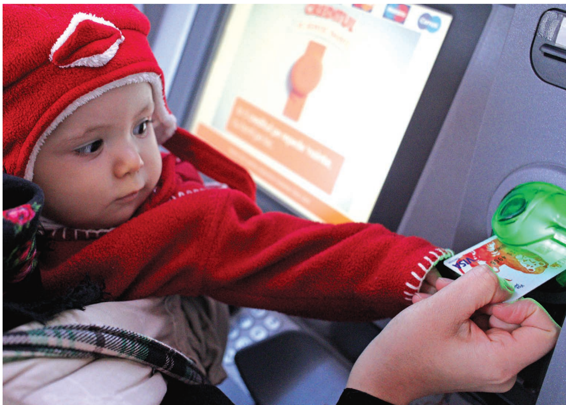
Ritkák a bankautomaták a vidéki településeken

Lenne igény a vidéki bankautomatákra, mégsem nyitottak ezek üzemeltetésére a bankok